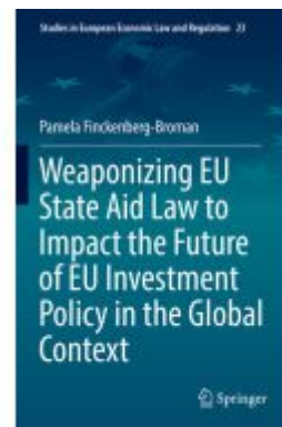
Weaponizing EU State Aid Law to Impact the Future of EU Investment Policy in the Global Context