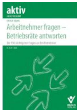
Arbeitnehmer fragen – Betriebsräte antworten