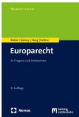
Europarecht Ladenpreis: 29,80EUR