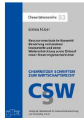
Ressourcenschutz im Baurecht: Bewertung vorhandener Instrumente und deren Weiterentwicklung sowie Entwurf neuer Steuerungsmechanismen Ladenpreis: 41,10EUR