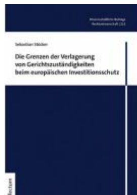
Die Grenzen der Verlagerung von Gerichtszuständigkeiten beim europäischen Investitionsschutz Ladenpreis: 65,80EUR