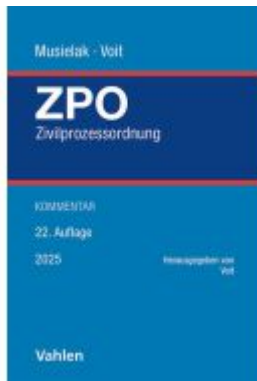
Zivilprozessordnung Ladenpreis: 190,20EUR

Wir haben andere Produkte gefunden, die Ihnen gefallen könnten!