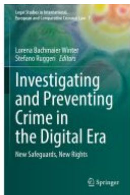
Investigating and Preventing Crime in the Digital Era