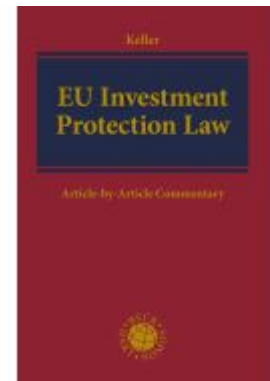
EU Investment Protection Law Ladenpreis: 257,10EUR