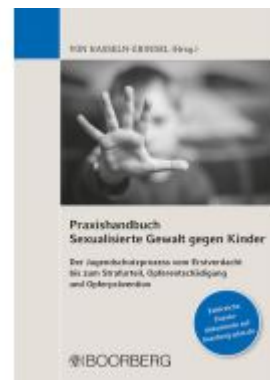
Praxishandbuch Sexualisierte Gewalt gegen Kinder Ladenpreis: 71,00EUR