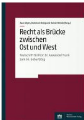
Recht als Brücke zwischen Ost und West