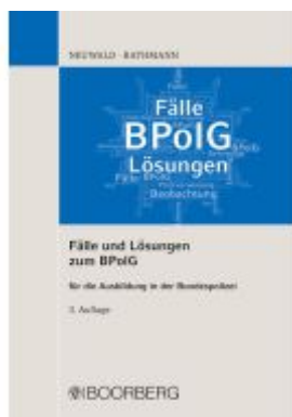
Fälle und Lösungen zum BPolG Ladenpreis: 23,60EUR