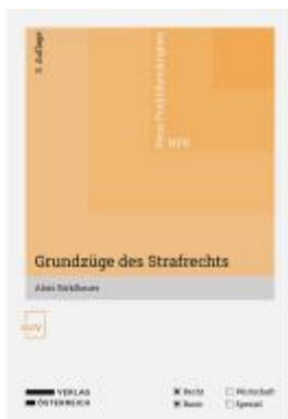
Grundzüge des Strafrechts