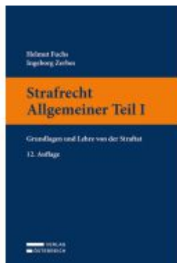
Strafrecht Allgemeiner Teil I Ladenpreis: 55,00EUR