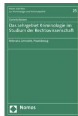
Das Lehrgebiet Kriminologie im Studium der Rechtswissenschaft Ladenpreis: 117,20EUR