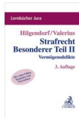
Strafrecht Besonderer Teil II