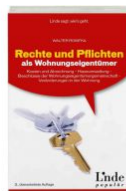
Rechte und Pflichten als Wohnungseigentümer Ladenpreis: 39,00 EUR