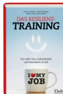
Das Resilienz-Training Ladenpreis: 24,90 EUR