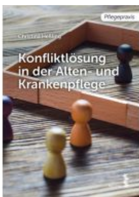
Konfliktlösung in der Pflege Ladenpreis: 9,90 EUR