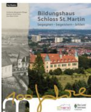
Bildungshaus Schloss St. Martin - 100 Jahre - begegnen - begeistern - bilden Ladenpreis: 25,00 EUR