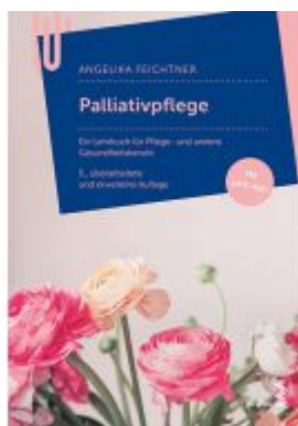
Palliativpflege Ladenpreis: 28,90 EUR