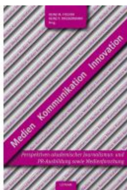
Medien – KÖmmunikation – Innovation Ladenpreis: 14,90 EUR