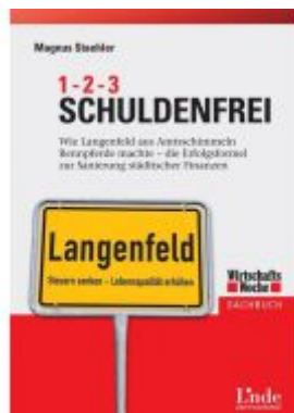
1-2-3 Schuldenfrei Ladenpreis: 25,60 EUR