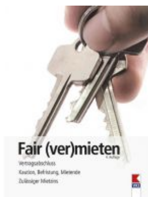
Fair (ver)mieten Ladenpreis: 19,90 EUR