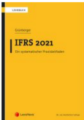
IFRS 2021 Ladenpreis: 42,00 EUR