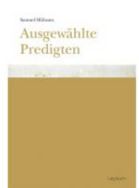
Samuel Mühsam. Ausgewählte Predigten Ladenpreis: 18,00 EUR