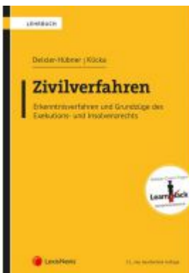
Zivilverfahren Ladenpreis: 64,00 EUR