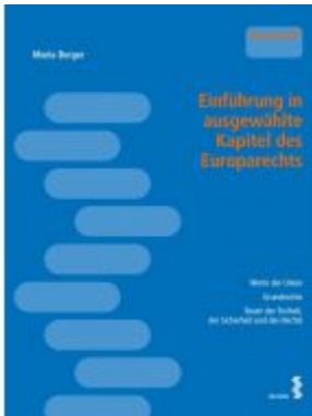
Einführung in ausgewählte Kapitel des Europarechts Ladenpreis: 20,00 EUR