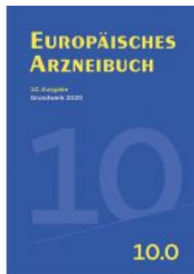
Europäisches Arzneibuch Ladenpreis: 248,00 EUR