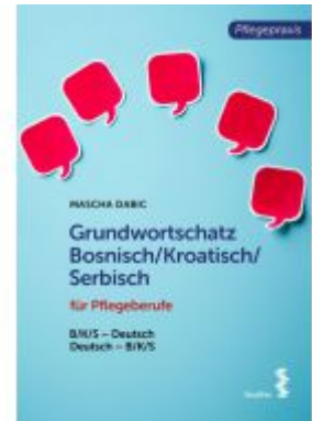
Grundwortschatz Bosnisch/Kroatisch/Serbisch für Pflegeberufe Ladenpreis: 18,90 EUR