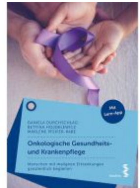
Onkologische Gesundheits- und Krankenpflege Ladenpreis: 24,90 EUR