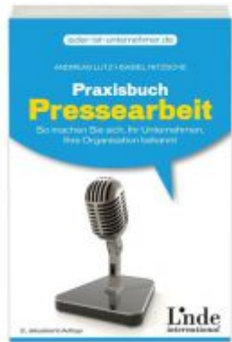
Praxisbuch Pressearbeit Ladenpreis: 18,40 EUR