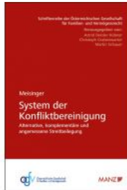
System der Konfliktbereinigung Ladenpreis: 48,00 EUR