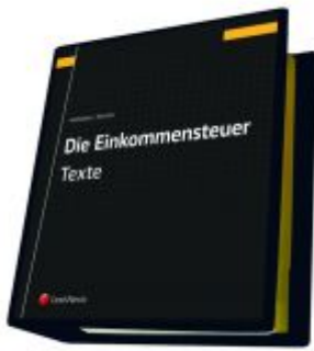
Die Einkommensteuer (EStG 1988) Band I - Texte Ladenpreis: 287,00 EUR