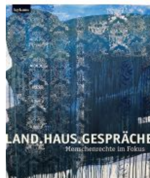
Land.Haus.Gespräche. Menschenrechte im Fokus Ladenpreis: 29,00 EUR