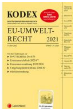
KODEX EU-Umweltrecht 2021 Ladenpreis: 103,00 EUR

Wir haben andere Produkte gefunden, die Ihnen gefallen könnten!