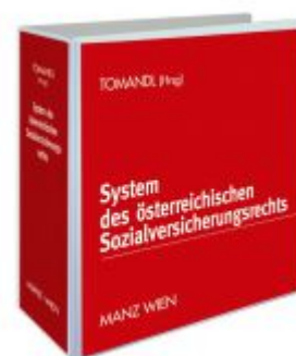
System des österreichischen Sozialversicherungsrechts Ladenpreis: 258,00 EUR