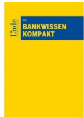
Bankwissen kompakt Ladenpreis: 58,00 EUR