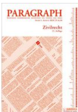
Paragraph - Zivilrecht Ladenpreis: 16,90 EUR