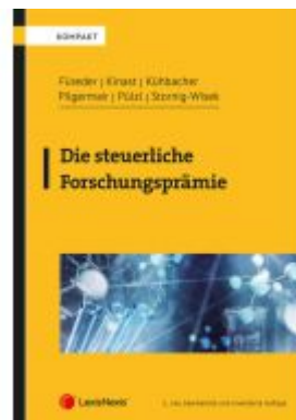
Die steuerliche Forschungsprämie Ladenpreis: 54,00EUR