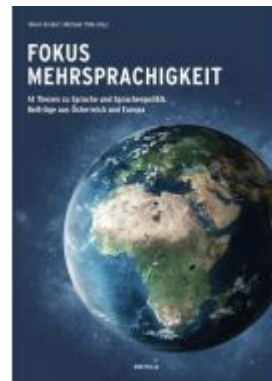
Fokus Mehrsprachigkeit. Ladenpreis: 36,00EUR