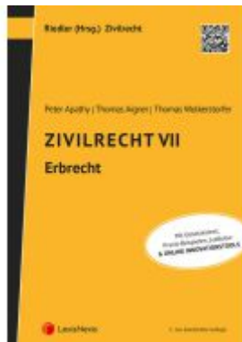
Zivilrecht VII - Erbrecht Ladenpreis: 32,00EUR