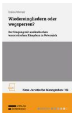
Wiedereingliedern oder wegsperren? Ladenpreis: 54,00EUR