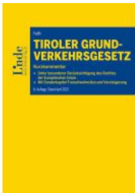
Tiroler Grundverkehrsgesetz Ladenpreis: 50,00EUR

Wir haben andere Produkte gefunden, die Ihnen gefallen könnten!