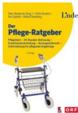
Der Pflege-Ratgeber Ladenpreis: 29,90EUR