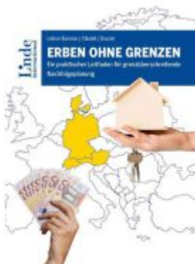
Erben ohne Grenzen Ladenpreis: 49,00EUR