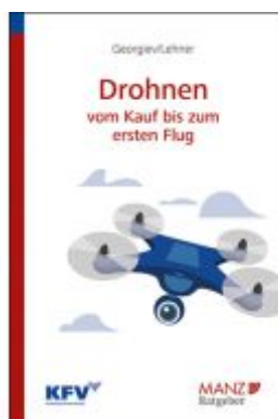
Drohnen - Vom Kauf bis zum ersten Flug Ladenpreis: 23,80EUR