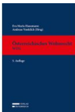
Österreichisches Wohnrecht - WEG Ladenpreis: 289,00EUR