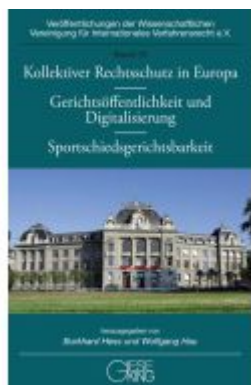
Kollektiver Rechtsschutz in Europa – Gerichtsöffentlichkeit und Digitalisierung – Sportschiedsgerichtsbarkeit Ladenpreis: 60,70EUR