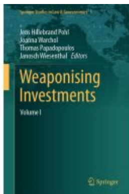
Weaponising Investments Ladenpreis: 197,99EUR