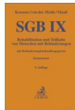
SGB IX Ladenpreis: 122,40EUR