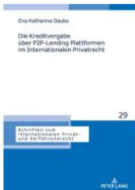
Die Kreditvergabe über P2P-Lending Plattformen im Internationalen Privatrecht Ladenpreis: 82,20EUR