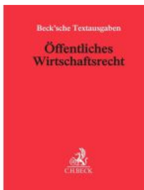
Öffentliches Wirtschaftsrecht Ladenpreis: 60,70EUR