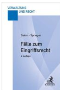
Fälle zum Eingriffsrecht Ladenpreis: 26,70EUR