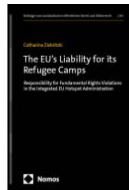
The EU's Liability for its Refugee Camps Ladenpreis: 142,90EUR