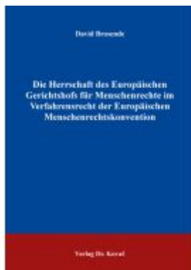
Die Herrschaft des Europäischen Gerichtshofs für Menschenrechte im Verfahrensrecht der Europäischen Menschenrechtskonvention Ladenpreis: 143,80EUR