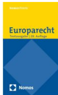
Europarecht Ladenpreis: 20,50EUR