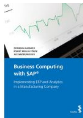
Business Computing with SAP® Ladenpreis: 48,00EUR