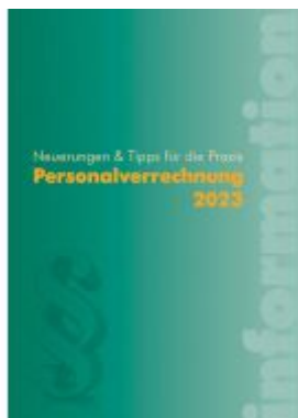
Personalverrechnung 2023 Ladenpreis: 44,00EUR