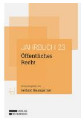
Öffentliches Recht Ladenpreis: 89,00EUR