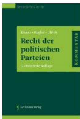
Recht der politischen Parteien Ladenpreis: 174,00EUR