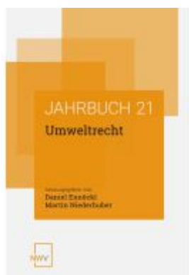
Umweltrecht Ladenpreis: 54,80EUR