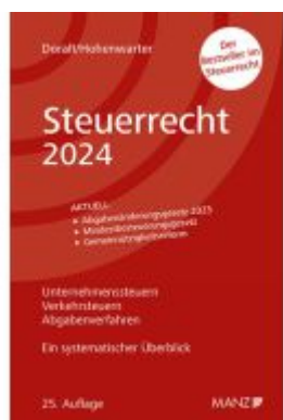
Steuerrecht 2024 Ladenpreis: 39,00EUR