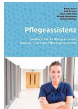
Pflegeassistent Ladenpreis: 52,90EUR