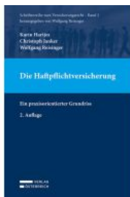
Die Haftpflichtversicherung Ladenpreis: 69,00EUR