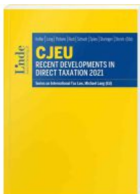
CJEU - Recent Developments in Direct Taxation 2021 Ladenpreis: 85,00EUR