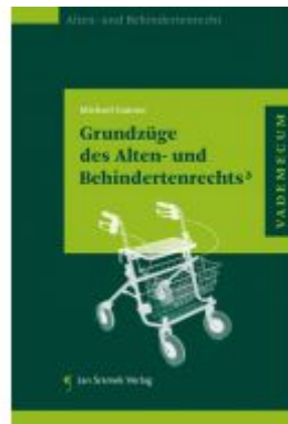
Grundzüge des Alten- und Behindertenrechts 3 Ladenpreis: 55,00 EUR