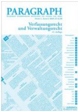
Paragraph - Verfassungs- und Verwaltungsrecht Ladenpreis: 16,90 EUR