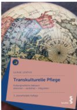
Transkulturelle Pflege Ladenpreis: 24,90 EUR