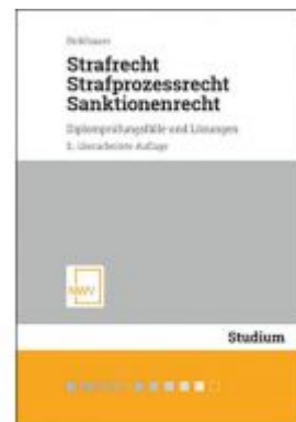
Strafrecht, Strafprozessrecht, Sanktionenrecht Ladenpreis: 32,00 EUR