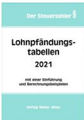
Lohnpfändungstabellen 2021 Ladenpreis: 18,70 EUR