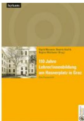
110 Jahre Lehrer/innenbildung am Hasnerplatz in Graz – Eine Festschrift Ladenpreis: 25,00 EUR