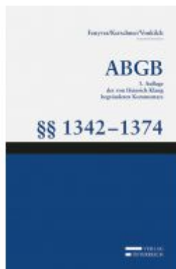
Großkommentar zum ABGB - Klang Kommentar Ladenpreis: 185,00 EUR