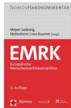
EMRK - Europäische Menschenrechtskonvention Ladenpreis: 142,90EUR