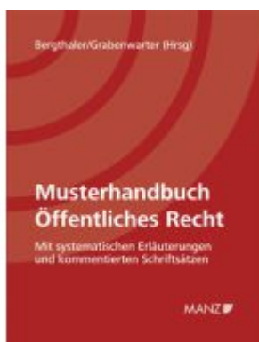
Musterhandbuch Öffentliches Recht Ladenpreis: 248,00EUR