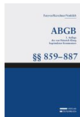
Großkommentar zum ABGB - Klang Kommentar Ladenpreis: 544,00EUR