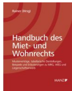
Handbuch des Miet- und Wohnrechts Ladenpreis: 198,00EUR