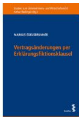
Vertragsänderungen per Erklärungsfiktionsklausel Ladenpreis: 62,00EUR