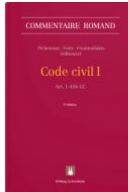
Code civil I Ladenpreis: 658,00EUR