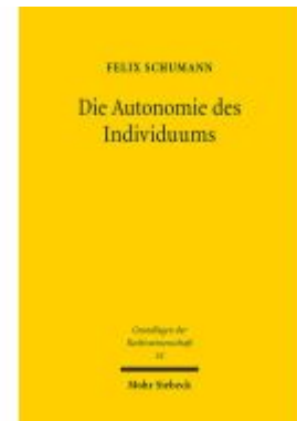
Die Autonomie des Individuums Ladenpreis: 107,00EUR