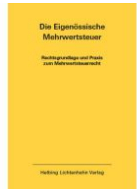
Die Eidgenössische Mehrwertsteuer EL 49 Ladenpreis: 152,00EUR