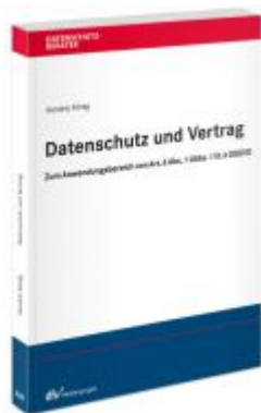
Datenschutz und Vertrag Ladenpreis: 71,00EUR