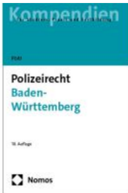
Polizeirecht Baden-Württemberg Ladenpreis: 30,80EUR