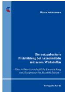
Die nutzenbasierte Preisbildung bei Arzneimitteln mit neuen Wirkstoffen Ladenpreis: 102,60EUR