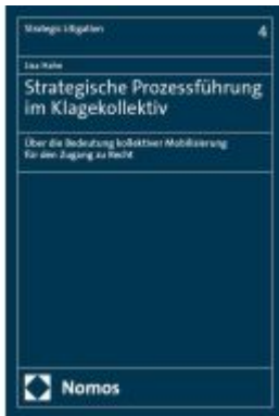
Strategische Prozessführung im Klagekollektiv Ladenpreis: 199,50EUR