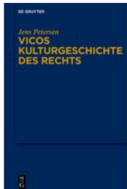
Vicos Kulturgeschichte des Rechts Ladenpreis: 79,95EUR