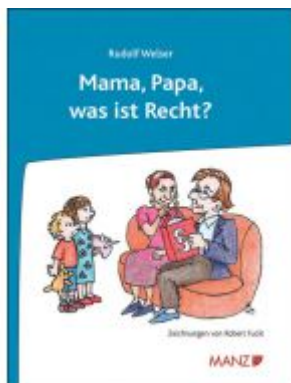
Mama, Papa, was ist Recht? Ladenpreis: 18,80 EUR

Wir haben andere Produkte gefunden, die Ihnen gefallen könnten!