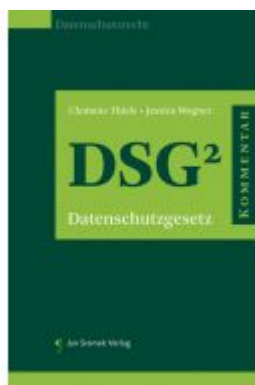
Praxiskommentar zum Datenschutzgesetz (DSG) Ladenpreis: 178,00 EUR