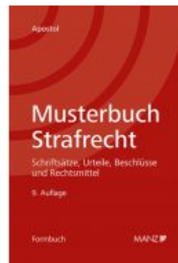
Musterbuch Strafrecht Ladenpreis: 108,00 EUR