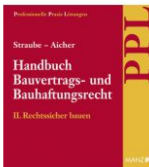
PAKET: Handbuch Bauvertrags- und Bauhaftungsrecht Band II: Rechtssicher Bauen Ladenpreis: 198,00 EUR