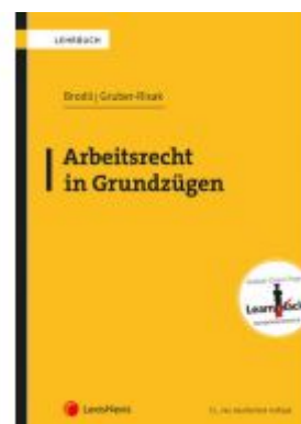
Arbeitsrecht in Grundzügen Ladenpreis: 51,00 EUR