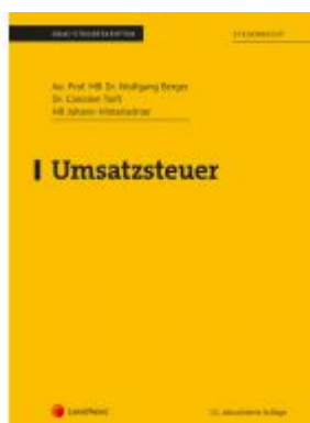
Umsatzsteuer (Skriptum) Ladenpreis: 28,00 EUR