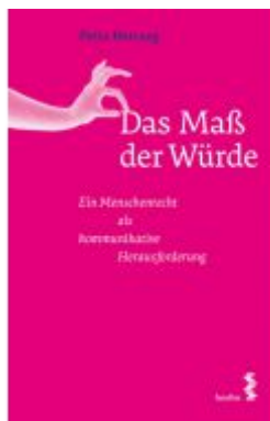
Das Maß der Würde Ladenpreis: 24,00 EUR