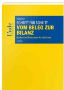
Schritt für Schritt vom Beleg zur Bilanz Ladenpreis: 38,00 EUR