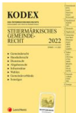
KODEX Steiermärkisches Gemeindefachrecht 2022 - inkl. App Ladenpreis: 87,00EUR

Wir haben andere Produkte gefunden, die Ihnen gefallen könnten!