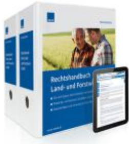
Rechtshandbuch Land- und Forstwirtschaft Ladenpreis: 239,80EUR