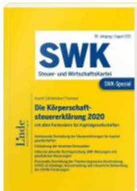
SWK-Spezial Die Körperschaftsteuererklärung 2020 Ladenpreis: 48,00EUR