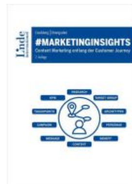
#marketinginsights Ladenpreis: 39,00EUR