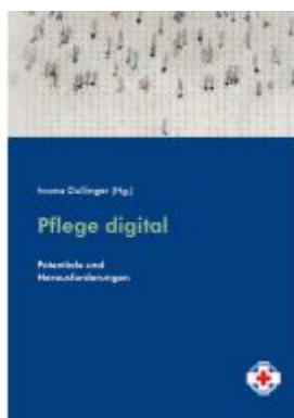
Pflege digital Ladenpreis: 16,90EUR