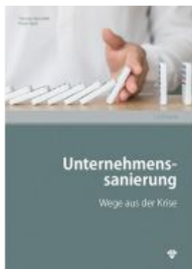
Unternehmenssanierung Ladenpreis: 31,90EUR