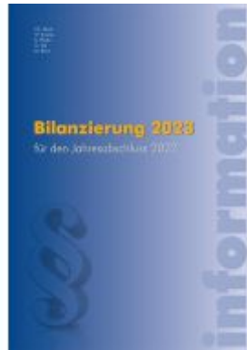
Bilanzierung 2023 Ladenpreis: 49,50EUR