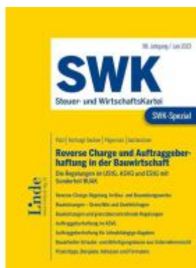
SWK-Spezial Reverse Charge und Auftraggeberhaftung in der Bauwirtschaft Ladenpreis: 35,00EUR