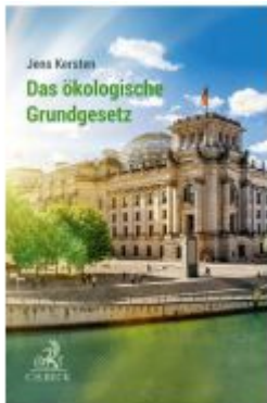
Das ökologische Grundgesetz Ladenpreis: 36,00EUR