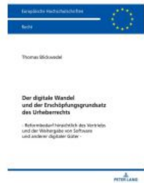
Der digitale Wandel und der Erschöpfungsgrundsatz des Urheberrechts Ladenpreis: 56,50EUR