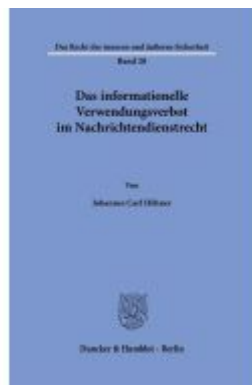
Das informationelle Verwendungsverbot im Nachrichtendienstrecht. Ladenpreis: 92,50EUR