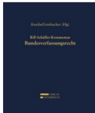
Rill-Schäffer-Kommentar Bundesverfassungsrecht Ladenpreis: 1.298,00EUR