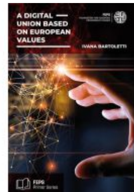
A digital union based on European values Ladenpreis: 12,40EUR