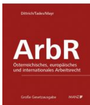
Arbeitsrecht Ladenpreis: 338,00 EUR