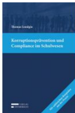
Korruptionsprävention und Compliance im Schulwesen Ladenpreis: 39,00 EUR

Wir haben andere Produkte gefunden, die Ihnen gefallen könnten!