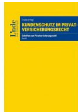
Kundenschutz im Privatversicherungsrecht Ladenpreis: 36,00 EUR