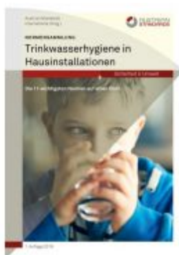
Normensammlung Trinkwasserhygiene in Hausinstallationen Ladenpreis: 174,90 EUR