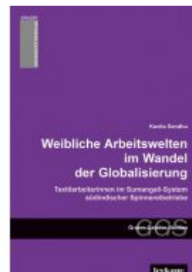
Weibliche Arbeitswelten im Wandel der Globalisierung. Textilarbeiterinnen im Sumangali-System südindischer Spinnereibetriebe. Ladenpreis: 19,90 EUR