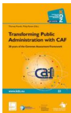
Transforming Public Administration with CAF Ladenpreis: 46,80 EUR