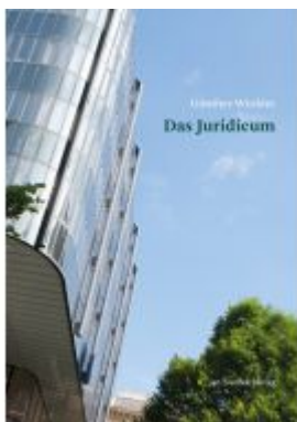
Das Juridicum Ladenpreis: 49,90 EUR