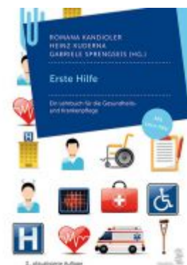
Erste Hilfe Ladenpreis: 24,90 EUR