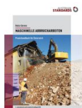
Maschinelle Abbrucharbeiten Ladenpreis: 75,90EUR