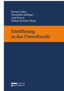
Einführung in das Umweltrecht Ladenpreis: 32,00EUR