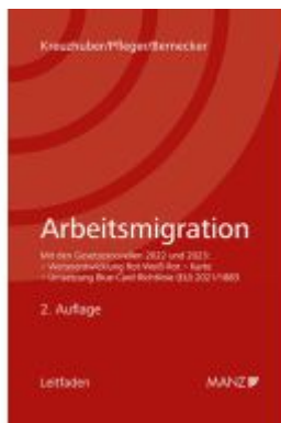
Arbeitsmigration Ladenpreis: 38,00EUR