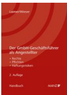
Der GmbH-Geschäftsführer als Angestellter Ladenpreis: 46,00EUR