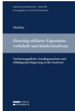
Einseitig erklärter Eigentumsvorbehalt und Käuferinsolvenz Ladenpreis: 119,00EUR