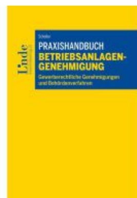
Praxishandbuch Betriebsanlagengenehmigung Ladenpreis: 39,00EUR