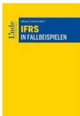
IFRS in Fallbeispielen Ladenpreis: 58,00EUR