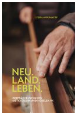
Neu.Land.Leben Ladenpreis: 25,00EUR