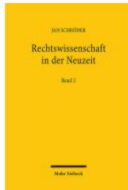
Rechtswissenschaft in der Neuzeit Ladenpreis: 137,80EUR