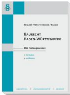
Baurecht Baden-Württemberg Ladenpreis: 25,60EUR