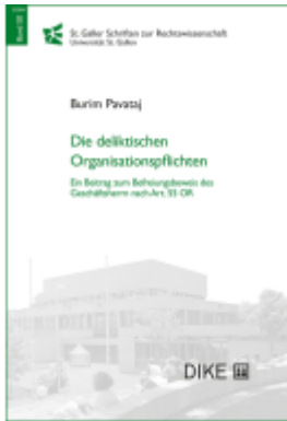
Die deliktischen Organisationspflichten Ladenpreis: 76,00EUR