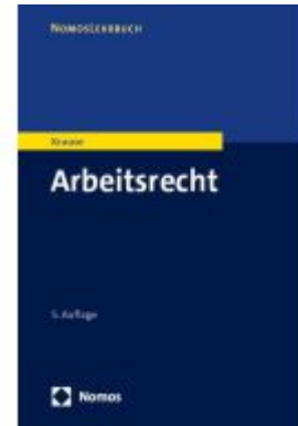
Arbeitsrecht Ladenpreis: 27,70EUR