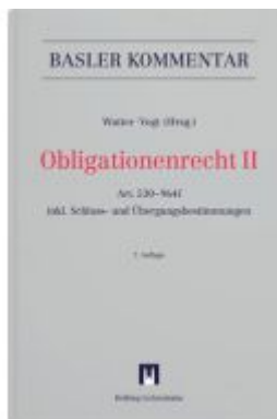
Obligationenrecht II Ladenpreis: 713,00EUR