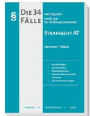
Die 34 wichtigsten Fälle Strafrecht AT Ladenpreis: 16,40EUR