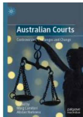
Australian Courts Ladenpreis: 153,99EUR