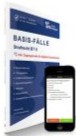
BASIS-FÄLLE Strafrecht BT II Ladenpreis: 26,70EUR

Wir haben andere Produkte gefunden, die Ihnen gefallen könnten!