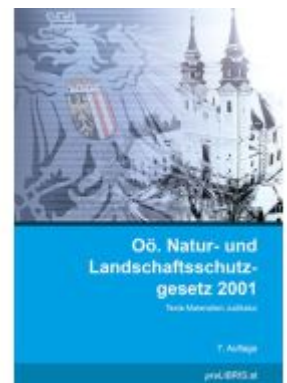
Oö. Natur- und Landschaftsschutzgesetz 2001 Ladenpreis: 28,00EUR