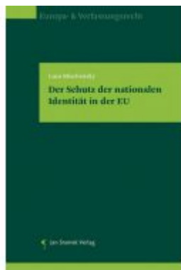
Der Schutz der nationalen Identität in der EU Ladenpreis: 78,00 EUR

Wir haben andere Produkte gefunden, die Ihnen gefallen könnten!