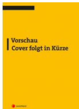
Strafrecht - Besonderer Teil II (Skriptum) Ladenpreis: 18,00 EUR