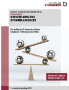
Normensammlung Risikomanagement Ladenpreis: 241,50 EUR