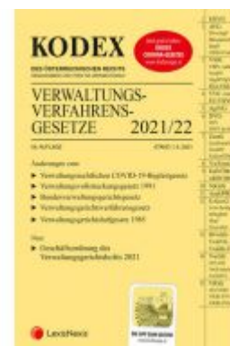
KODEX Verwaltungsverfahrgesetze (AVG) 2021/22 - inkl. App Ladenpreis: 24,00 EUR