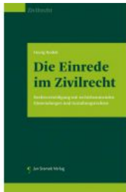
Die Einrede im Zivilrecht Ladenpreis: 118,00 EUR