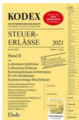
KODEX Steuer-Erlässe 2021, Band II Ladenpreis: 34,00 EUR