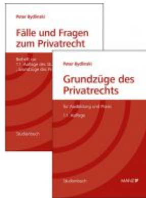
PAKET: Grundzüge des Privatrechts + Fälle und Fragen zum Privatrecht 11. Auflage Ladenpreis: 64,00 EUR