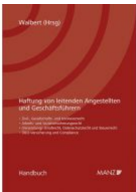
Haftung von leitenden Angestellten und Geschäftsführern Ladenpreis: 98,00 EUR