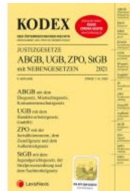
KODEX Justizgesetze 2021 Ladenpreis: 29,00 EUR