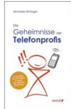
Die Geheimnisse des Telefonprofis Ladenpreis: 21,90 EUR