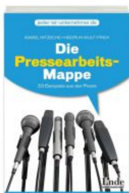
Die Pressearbeits-Mappe Ladenpreis: 19,90 EUR