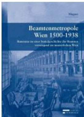
Beamtenmetropole Wien 1500-1938 Ladenpreis: 39,00 EUR

Wir haben andere Produkte gefunden, die Ihnen gefallen könnten!