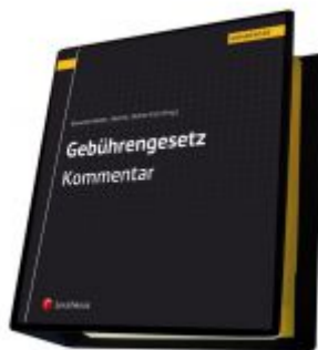
Gebührengesetz Kommentar Ladenpreis: 160,00 EUR