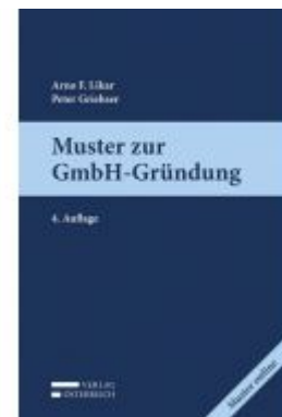
Muster zur GmbH-Gründung Ladenpreis: 52,00 EUR