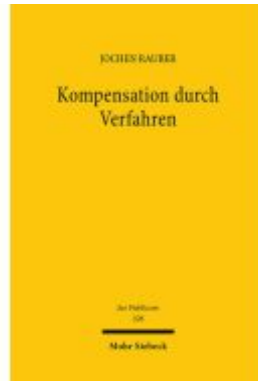
Kompensation durch Verfahren Ladenpreis: 122,40EUR