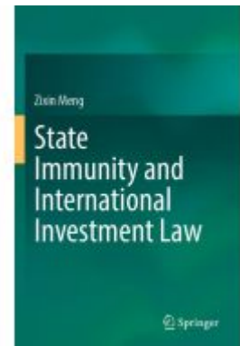
State Immunity and International Investment Law Ladenpreis: 142,99EUR