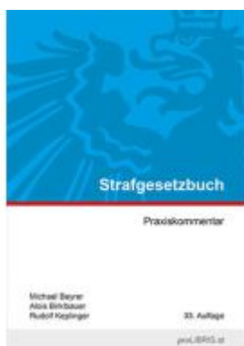
Strafgesetzbuch Ladenpreis: 33,00EUR