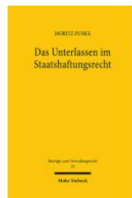
Das Unterlassen im Staatshaftungsrecht Ladenpreis: 91,50EUR