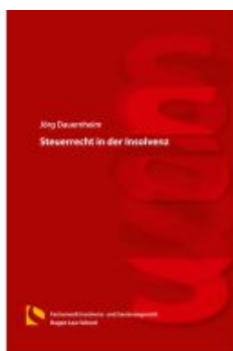
Steuerrecht in der Insolvenz Ladenpreis: 25,70EUR