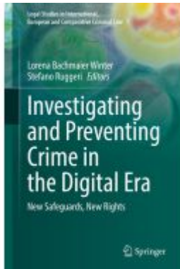
Investigating and Preventing Crime in the Digital Era Ladenpreis: 120,99EUR