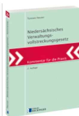
Niedersächsisches Verwaltungsvollstreckungsgesetz Ladenpreis: 41,10EUR