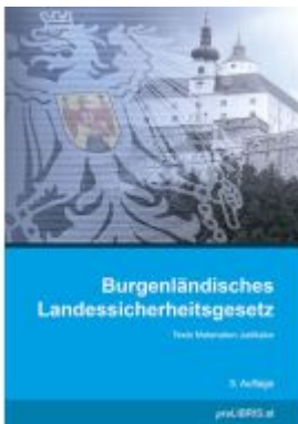
Burgenländisches Landessicherheitsgesetz Ladenpreis: 11,00EUR