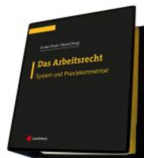
Das Arbeitsrecht - System und Praxiskommentar Ladenpreis: 348,00EUR