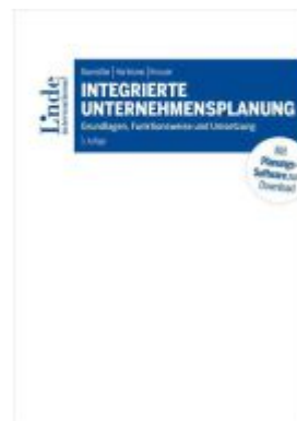
Integrierte Unternehmensplanung Ladenpreis: 65,00EUR