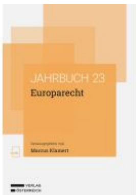
Europarecht Ladenpreis: 78,00EUR

Wir haben andere Produkte gefunden, die Ihnen gefallen könnten!