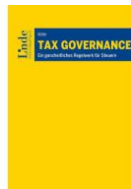
Tax Governance Ladenpreis: 59,00EUR