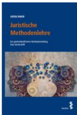
Juristische Methodenlehre Ladenpreis: 24,00EUR