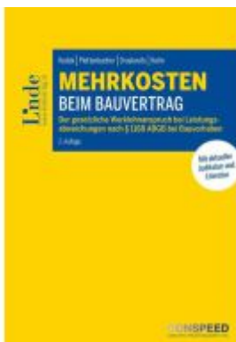
Mehrkosten beim Bauvertrag Ladenpreis: 62,00EUR