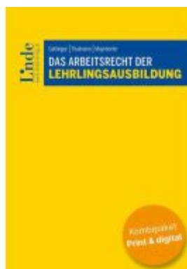
Das Arbeitsrecht der Lehrlingsausbildung (Kombi Print&digital) Ladenpreis: 99,00EUR