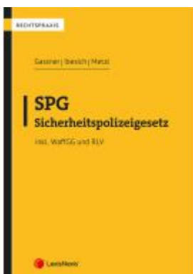
SPG - Sicherheitspolizeigesetz Ladenpreis: 39,00EUR