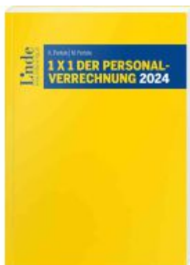
1 x 1 der Personalverrechnung 2024 Ladenpreis: 41,00EUR