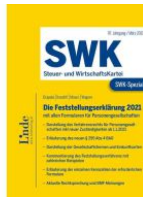
SWK-Spezial Die Feststellungserklärung 2021 Ladenpreis: 48,00EUR