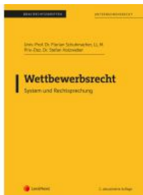
Wettbewerbsrecht (Skriptum) Ladenpreis: 27,50EUR