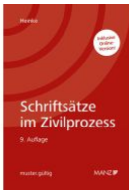
Schriftsätze im Zivilprozess Ladenpreis: 148,00EUR