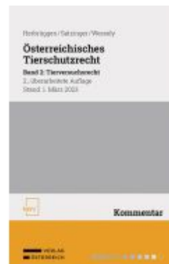
Österreichisches Tierschutzrecht Ladenpreis: 88,00EUR