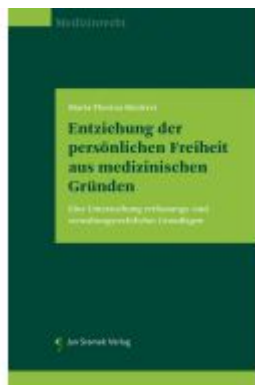
Entziehung der persönlichen Freiheit aus medizinischen Gründen Ladenpreis: 85,00EUR