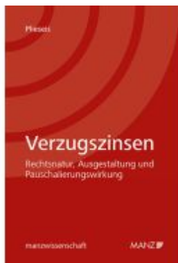
Verzugszinsen Ladenpreis: 74,00EUR