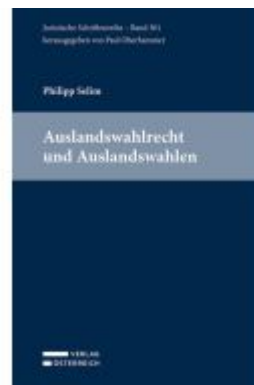
Auslandswahlrecht und Auslandswahlen Ladenpreis: 69,00EUR