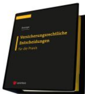
Versicherungsrechtliche Entscheidungen - aufbereitet für die Praxis Ladenpreis: 329,00EUR