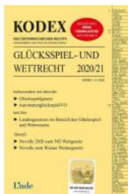
KODEX Glücksspiel- und Wettrecht 2020/21 Ladenpreis: 68,00 EUR