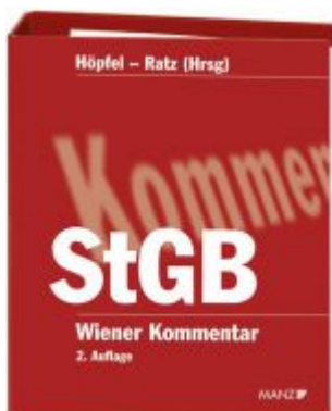
Wiener Kommentar zum Strafgesetzbuch 2. Auflage Ladenpreis: 648,00 EUR