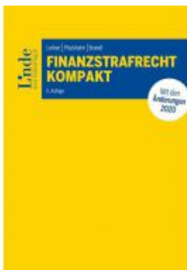
Finanzstrafrecht kompakt Ladenpreis: 48,00 EUR