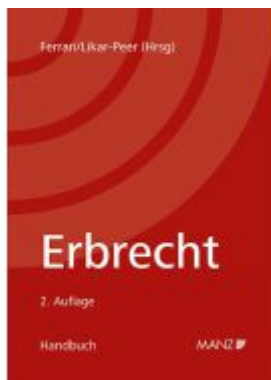
Erbrecht Ladenpreis: 160,00 EUR