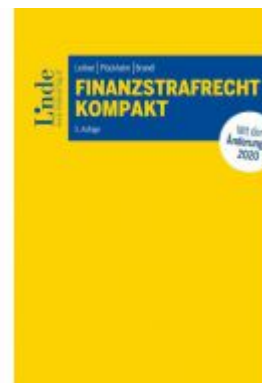
Finanzstrafrecht kompakt Ladenpreis: 48,00 EUR