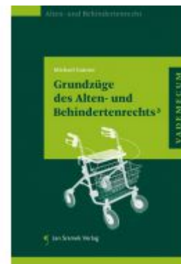
Grundzüge des Alten- und Behindertenrechts 3 Ladenpreis: 55,00 EUR