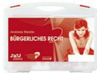
Medienkoffer Bürgerliches Recht Ladenpreis: 322,30 EUR