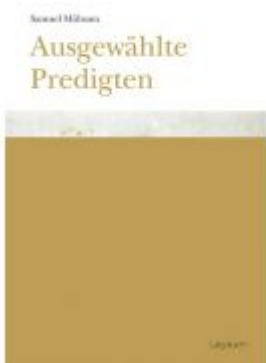
Samuel Mühsam. Ausgewählte Predigten Ladenpreis: 18,00 EUR