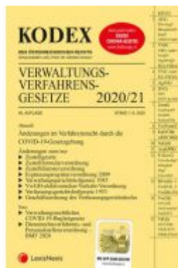
KODEX Verwaltungsverfahrensgesetze (AVG) 2020/21 Ladenpreis: 24,00 EUR