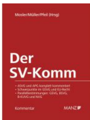
Der SV-Komm Ladenpreis: 398,00 EUR