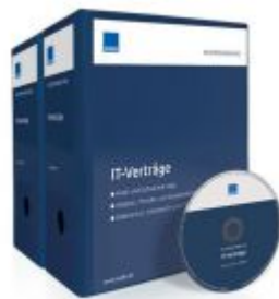
Mustersammlung IT-Verträge Ladenpreis: 207,90 EUR