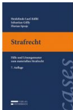
Casebook Strafrecht Ladenpreis: 36,00 EUR

Wir haben andere Produkte gefunden, die Ihnen gefallen könnten!