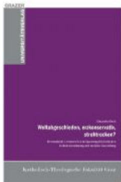
Weltabgeschieden, erzkonservativ, strohtrocken? Ladenpreis: 19,90 EUR

Wir haben andere Produkte gefunden, die Ihnen gefallen könnten!