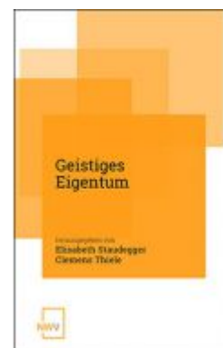
Geistiges Eigentum Ladenpreis: 68,00 EUR