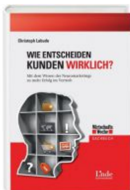
Wie entscheiden Kunden wirklich?