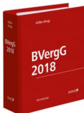
BVergG 2018 Ladenpreis: 258,00 EUR