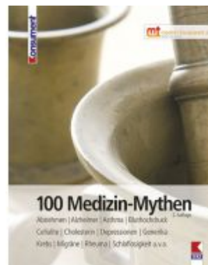
100 Medizin-Mythen Ladenpreis: 19,90 EUR