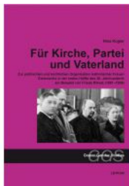
Für Kirche, Partei und "Vaterland"