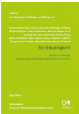
Nachhaltigkeit Ladenpreis: 16,90 EUR