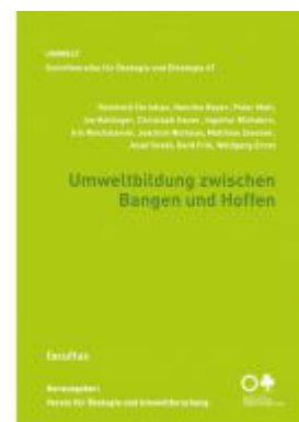
Umweltbildung zwischen Bangen und Hoffen Ladenpreis: 16,90 EUR