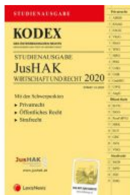
KODEX JusHAK Ladenpreis: 23,00 EUR