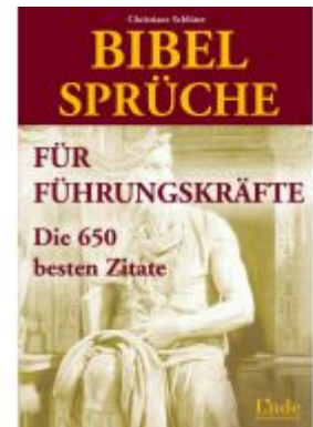
Bibelsprüche für Führungskräfte Ladenpreis: 18,50 EUR