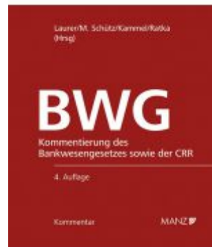
Bankwesengesetz - BWG 4.Auflage Ladenpreis: 378,00 EUR