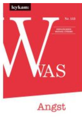
WAS 113 – Angst Ladenpreis: 14,90 EUR