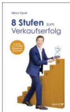
8 Stufen zum Verkaufserfolg Ladenpreis: 21,80 EUR