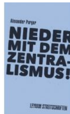
Nieder mit dem Zentralismus! Ladenpreis: 7,50 EUR