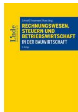
Rechnungswesen, Steuern und Betriebswirtschaft in der Bauwirtschaft Ladenpreis: 59,00EUR