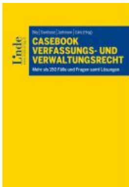
Casebook Verfassungs- und Verwaltungsrecht Ladenpreis: 29,00EUR

Wir haben andere Produkte gefunden, die Ihnen gefallen könnten!