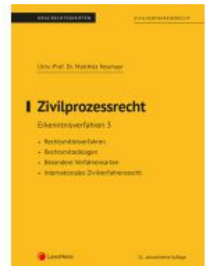
Zivilprozessrecht Erkenntnisverfahren 3 (Skriptum) Ladenpreis: 22,50EUR