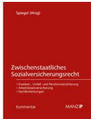
Zwischenstaatliches Sozialversicherungsrecht Ladenpreis: 219,00EUR