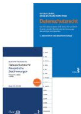
Kombipaket Datenschutzrecht und FlexLex Datenschutzrecht – Wesentliche Bestimmungen Ladenpreis: 38,00EUR