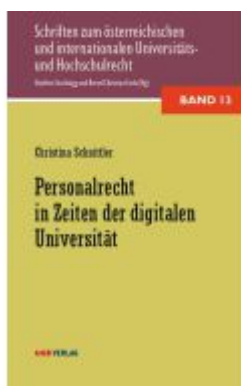
Personalrecht in Zeiten der digitalen Universität Ladenpreis: 36,00EUR