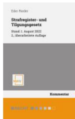
Strafregister- und Tilgungsgesetz Ladenpreis: 68,00EUR