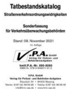
15. Ergänzungslieferung zum Bundeseinheitlicher Tatbestandskatalog, Sonderfassung für Verkehrsüberwachung Ladenpreis: 10,50EUR