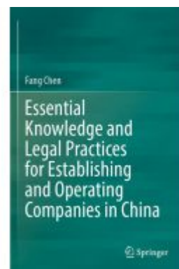
Essential Knowledge and Legal Practices for Establishing and Operating Companies in China Ladenpreis: 109,99EUR