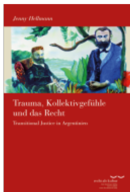
Trauma, Kollektivgefühle und das Recht Ladenpreis: 50,40EUR