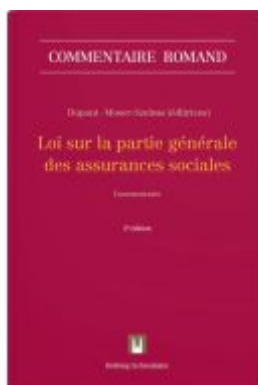
Loi sur la partie générale des assurances sociales Ladenpreis: 416,00EUR