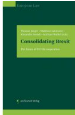
Consolidating Brexit Ladenpreis: 85,00EUR