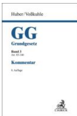
Grundgesetz Bd. 3: Artikel 83-146 Ladenpreis: 297,10EUR