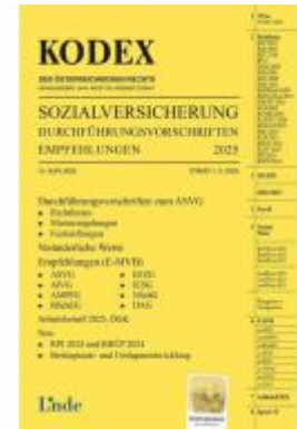
KODEX Sozialversicherung 2025, Band III Ladenpreis: 38,00EUR