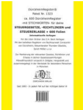
DürckheimRegister® Paket- STEUERGESetze-RILI-ERLASSE: 600 DürckheimRegister® mit STICHWORTEN + 600 FOLIEN Ladenpreis: 85,00EUR