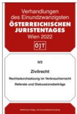
Zivilrecht Ladenpreis: 44,00EUR

Wir haben andere Produkte gefunden, die Ihnen gefallen könnten!