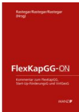
FlexKapGG-ON Ladenpreis: 138,00EUR