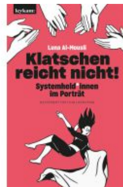
Klatschen reicht nicht! Ladenpreis: 22,00EUR