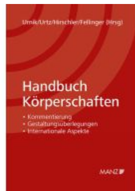
Handbuch Körperschaften Ladenpreis: 148,00EUR