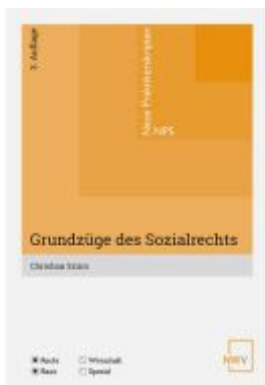
Grundzüge des Sozialrechts Ladenpreis: 23,00EUR