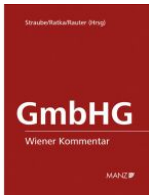
Wiener Kommentar zum GmbH-Gesetz Ladenpreis: 438,00EUR