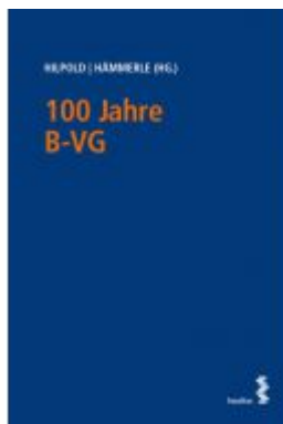
100 Jahre B-VG Ladenpreis: 25,00 EUR