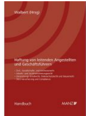
Haftung von leitenden Angestellten und Geschäftsführern Ladenpreis: 98,00 EUR