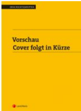
PAKET Edition Zivilrecht PLUS Ladenpreis: 143,00 EUR