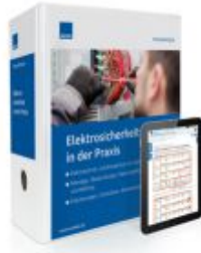
Elektrosicherheit in der Praxis Ladenpreis: 273,90 EUR