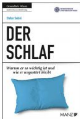
Der Schlaf Ladenpreis: 23,90 EUR