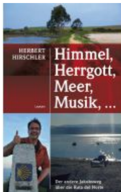
Himmel, Herrgott, Meer, Musik, ... Ladenpreis: 21,00 EUR