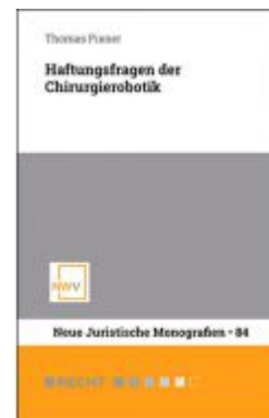
Haftungsfragen der Chirurgierobotik Ladenpreis: 54,00 EUR