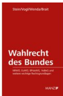
Wahlrecht des Bundes Ladenpreis: 138,00EUR