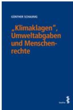
„Klimaklagen“, Umweltabgaben und Menschenrechte