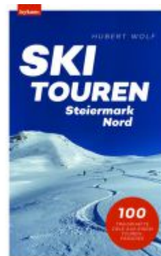
Skitouren Steiermark Nord Ladenpreis: 28,00EUR