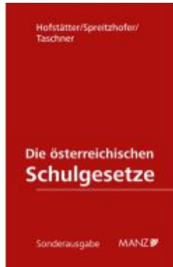
Die österreichischen Schulgesetze