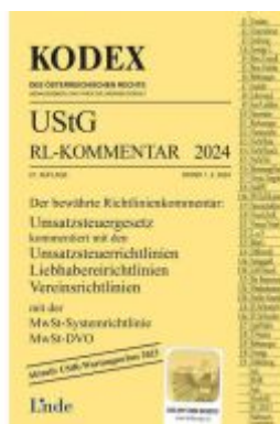
KODEX UStG-Richtlinien-Kommentar 2024 Ladenpreis: 56,00EUR