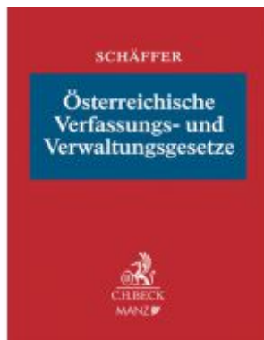
Österreichische Verfassungs- und Verwaltungsgesetze Ladenpreis: 199,00EUR