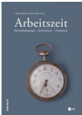
Arbeitszeit Ladenpreis: 45,00EUR

Wir haben andere Produkte gefunden, die Ihnen gefallen könnten!