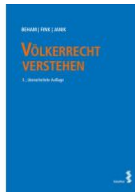
Völkerrecht verstehen Ladenpreis: 46,00EUR