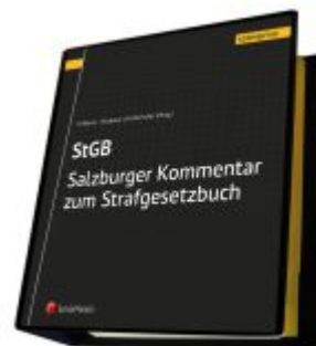
Salzburger Kommentar zum Strafgesetzbuch Ladenpreis: 689,00EUR