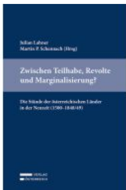
Zwischen Teilhabe, Revolte und Marginalisierung? Die Stände der österreichischen Länder in der Neuzeit (1500–1848/49) Ladenpreis: 59,00EUR