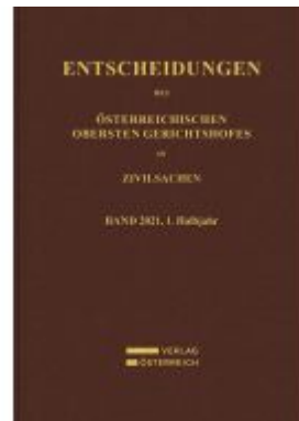
Entscheidungen des Obersten Gerichtshofes in Zivilsachen Ladenpreis: 249,00EUR