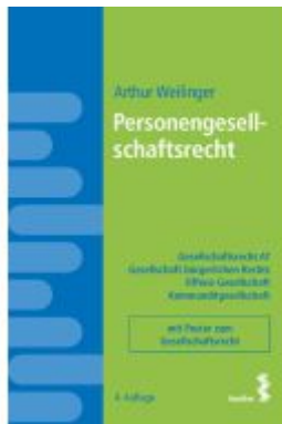
Personengesellschaftsrecht Ladenpreis: 28,00EUR