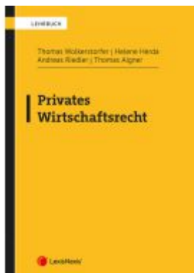
Privates Wirtschaftsrecht Ladenpreis: 42,00EUR