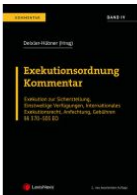
Exekutionsordnung - Kommentar Band 4 Ladenpreis: 164,00EUR