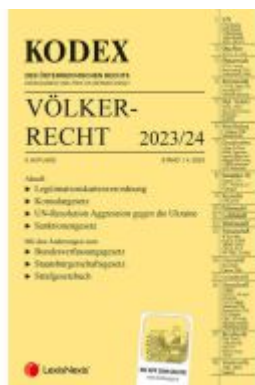
KODEX Völkerrecht 2023 - inkl. App Ladenpreis: 40,00EUR