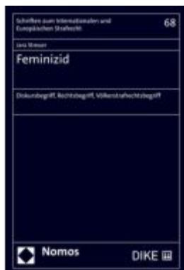
Feminizid Ladenpreis: 148,10EUR