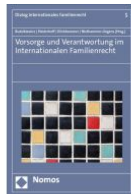
Vorsorge und Verantwortung im Internationalen Familienrecht Ladenpreis: 55,60EUR