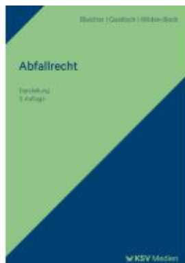
Abfallrecht Ladenpreis: 71,00EUR