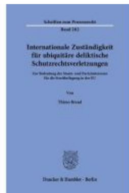
Internationale Zuständigkeit für ubiquitäre deliktische Schutzrechtsverletzungen. Ladenpreis: 102,70EUR