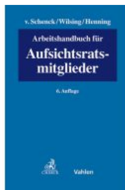
Arbeitshandbuch für Aufsichtsratsmitglieder Ladenpreis: 204,60EUR