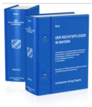
Der Rechtspfleger in Bayern Ladenpreis: 123,40EUR