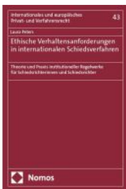
Ethische Verhaltensanforderungen in internationalen Schiedsverfahren Ladenpreis: 117,20EUR