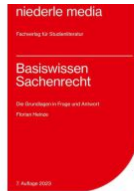
Basiswissen Sachenrecht - 2023 Ladenpreis: 12,30EUR