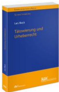
Tätowierung und Urheberrecht Ladenpreis: 100,80EUR