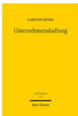
Unternehmenshaftung Ladenpreis: 153,20EUR