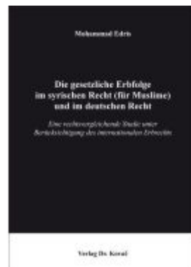
Die gesetzliche Erbfolge im syrischen Recht (für Muslime) und im deutschen Recht Ladenpreis: 102,60EUR