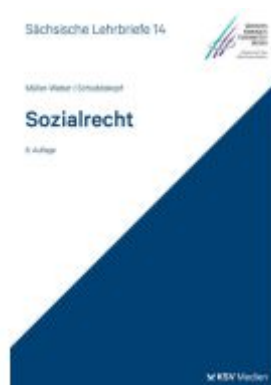
Sozialrecht (SL 14) Ladenpreis: 25,70EUR