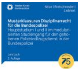
Musterklausuren Disziplinarrecht für die Bundespolizei Ladenpreis: 20,60EUR