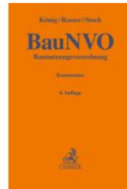
Baunutzungsverordnung Ladenpreis: 153,20EUR