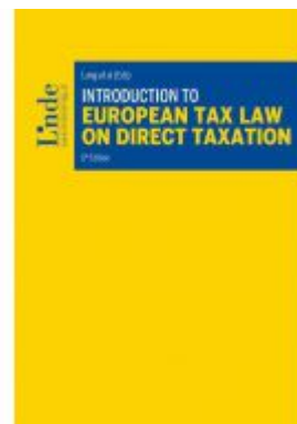
Introduction to European Tax Law on Direct Taxation Ladenpreis: 54,00 EUR