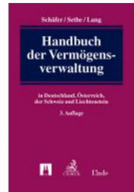
Handbuch der Vermögensverwaltung Ladenpreis: 229,00 EUR