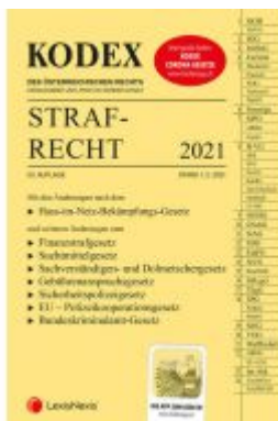
KODEX Strafrecht 2021 - inkl. App Ladenpreis: 36,00 EUR