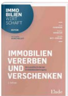
Immobilien vererben und verschenken Ladenpreis: 34,00 EUR