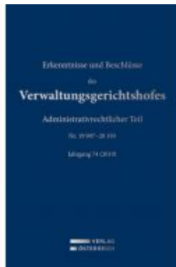
Erkenntnisse und Beschlüsse des Verwaltungsgerichtshofes Ladenpreis: 419,00 EUR

Wir haben andere Produkte gefunden, die Ihnen gefallen könnten!