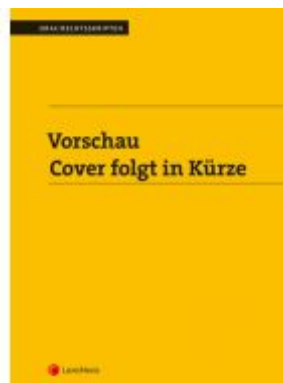
Personengesellschaften (Skriptum) Ladenpreis: 18,00 EUR