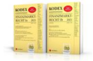
KODEX Finanzmarktrecht Band Ia + Ib 2021 - inkl. App Ladenpreis: 95,00 EUR