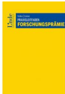
Praxisleitfaden Forschungsprämie Ladenpreis: 58,00 EUR