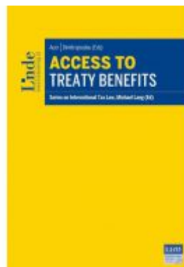
Access to Treaty Benefits Ladenpreis: 98,00 EUR