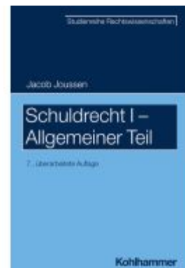
Schuldrecht I - Allgemeiner Teil Ladenpreis: 43,20EUR