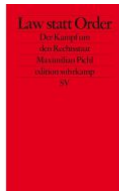
Law statt Order Ladenpreis: 18,50EUR