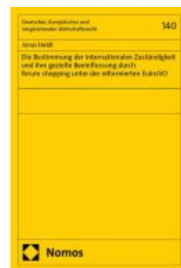
Die Bestimmung der internationalen Zuständigkeit und ihre gezielte Beeinflussung durch forum shopping unter der reformierten EUnVO Ladenpreis: 204,60EUR