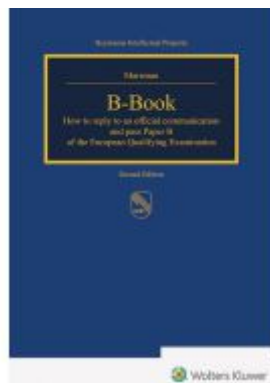
B-Book Ladenpreis: 122,40EUR