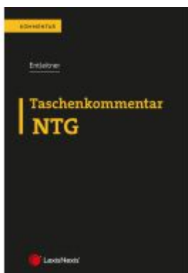
Taschenkommentar NTG Ladenpreis: 42,00EUR