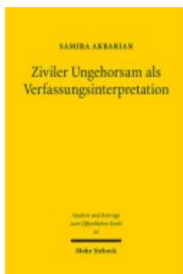
Ziviler Ungehorsam als Verfassungsinterpretation Ladenpreis: 86,40EUR