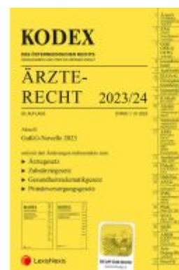
KODEX Ärzterecht 2023/24 - inkl. App Ladenpreis: 99,00EUR