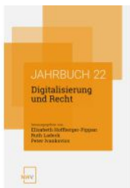
Digitalisierung und Recht Ladenpreis: 84,00EUR