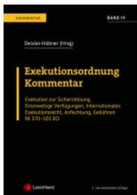
Exekutionsordnung - Kommentar Band 4 Ladenpreis: 164,00EUR