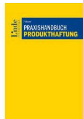
Praxishandbuch Produkthaftung Ladenpreis: 39,00EUR