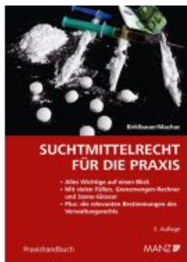
Suchtmittelrecht für die Praxis Ladenpreis: 32,00EUR