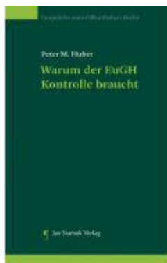
Warum der EuGH Kontrolle braucht Ladenpreis: 24,90EUR