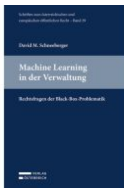
Machine Learning in der Verwaltung Ladenpreis: 139,00EUR