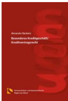
Öffentliches Dienstrecht Ladenpreis: 46,30EUR