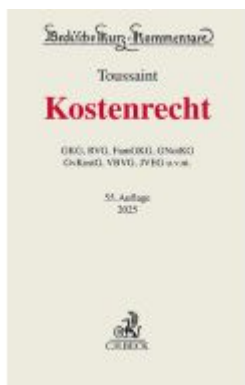
Kostenrecht Ladenpreis: 180,00EUR