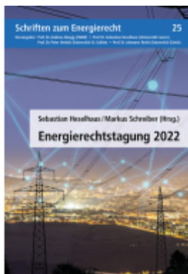
Energierectstagung 2022 Ladenpreis: 62,00EUR