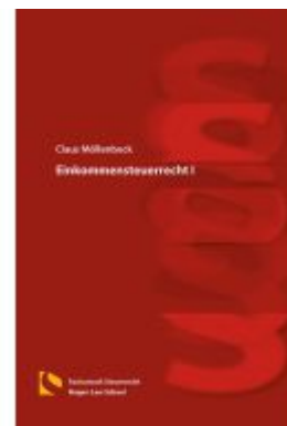
Einkommensteuerrecht I Ladenpreis: 25,70EUR