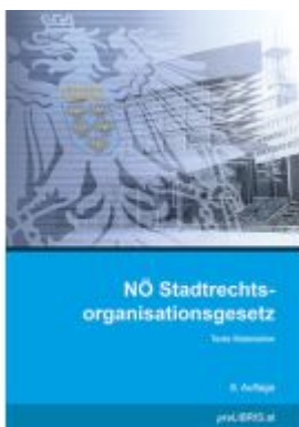
NÖ Stadtrechtsorganisationsgesetz Ladenpreis: 26,00EUR