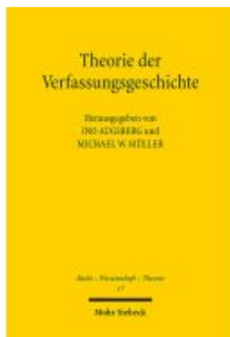
Theorie der Verfassungsgeschichte Ladenpreis: 76,10EUR