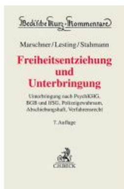
Freiheitsentziehung und Unterbringung Ladenpreis: 163,50EUR