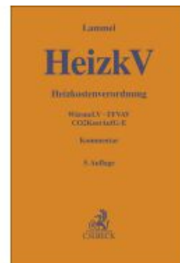
Heizkostenverordnung Ladenpreis: 81,30EUR