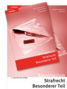
Strafrecht Besonderer Teil Kombipaket Ladenpreis: 78,20EUR

Wir haben andere Produkte gefunden, die Ihnen gefallen könnten!