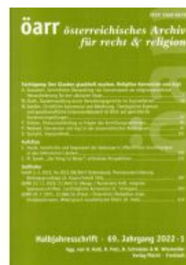
Österreichisches Archiv für Recht und Religion Ladenpreis: 35,00EUR