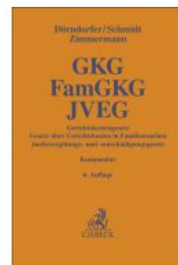
Gerichtskostengesetz, Gesetz über Gerichtskosten in Familiensachen, Justizvergütungs- und - entschädigungsgesetz Ladenpreis: 132,70EUR