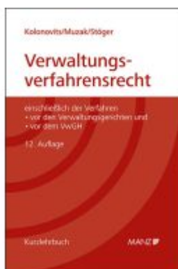
Grundriss des österreichischen Verwaltungsverfahrenrechts Ladenpreis: 76,00EUR