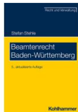
Beamtenrecht Baden-Württemberg Ladenpreis: 45,20EUR