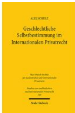
Geschlechtliche Selbstbestimmung im Internationalen Privatrecht Ladenpreis: 86,40EUR