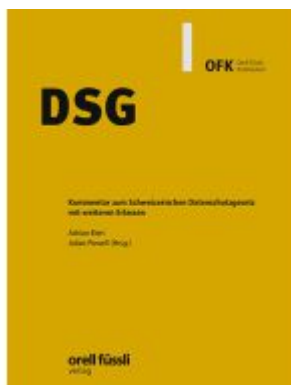
DSG Ladenpreis: 203,60EUR