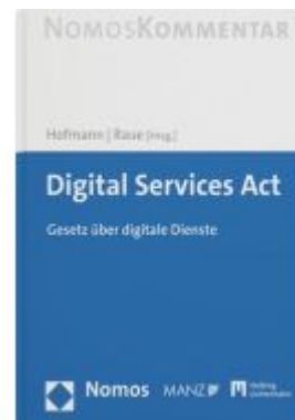
Digital Services Act Ladenpreis: 159,00EUR