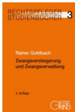
Zwangsversteigerung und Zwangsverwaltung Ladenpreis: 40,10EUR