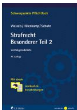
Strafrecht Besonderer Teil 2 Ladenpreis: 28,80EUR