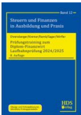
Prüfungstraining zum Diplom-Finanzwirt Laufbahnprüfung 2024/2025 Ladenpreis: 44,20EUR