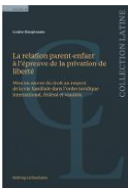
La relation parent-enfant à l'épreuve de la privation de liberté Ladenpreis: 108,00EUR