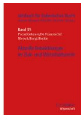
Aktuelle Entwicklungen im Zivil- und Wirtschaftsrecht Ladenpreis: 123,40EUR