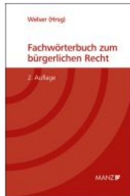
Fachwörterbuch zum bürgerlichen Recht Ladenpreis: 89,00EUR