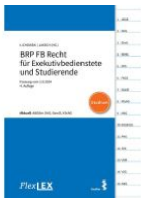
FlexLex BRP FB Recht für Exekutivbedienstete und Studierende | Studium Ladenpreis: 15,00EUR