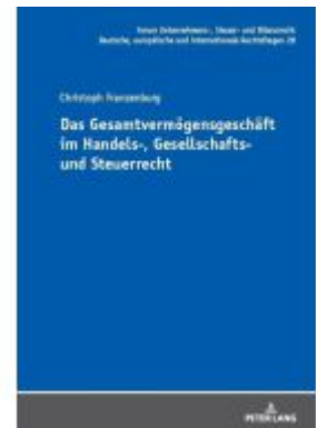
Das Gesamtvermögensgeschäft im Handels-, Gesellschafts- und Steuerrecht Ladenpreis: 82,20EUR