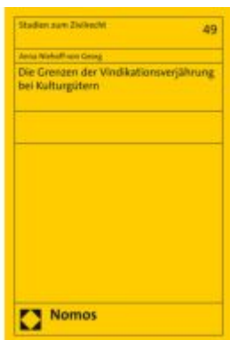
Die Grenzen der Vindikationsverjährung bei Kulturgütern Ladenpreis: 112,10EUR