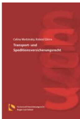
Transport- und Speditionsversicherungsrecht Ladenpreis: 25,70EUR