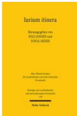
Iurium itinera Ladenpreis: 235,50EUR