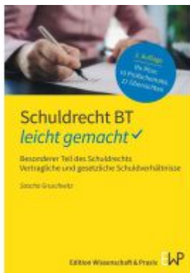
Schuldrecht BT – leicht gemacht Ladenpreis: 16,40EUR