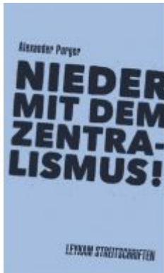
Nieder mit dem Zentralismus! Ladenpreis: 7,50 EUR