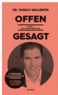
Offen gesagt Band 4 - Die Verantwortung Ladenpreis: 19,80 EUR