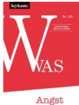
WAS 113 – Angst Ladenpreis: 14,90 EUR