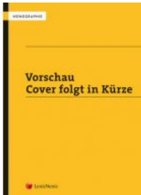
Mustersammlung zum GmbH-Recht / Mustersammlung zum GmbH-Recht, Band IV - Beendigung, Umgründung, Unternehmensverträge Ladenpreis: 299,00 EUR