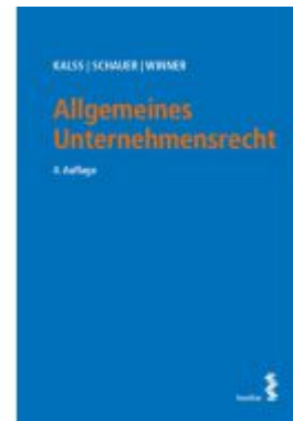
Allgemeines Unternehmensrecht Ladenpreis: 43,00 EUR