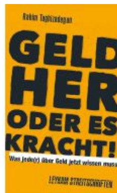
Geld her oder es kracht! Was jede(r) über Geld jetzt wissen muss! Ladenpreis: 12,00 EUR