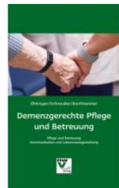
Demenzgerechte Pflege und Betreuung Ladenpreis: 29,80 EUR