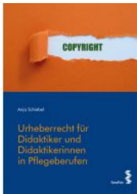
Urheberrecht für Didaktiker/Didaktikerinnen in Pflegeberufen Ladenpreis: 16,90 EUR

Wir haben andere Produkte gefunden, die Ihnen gefallen könnten!