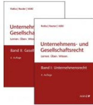
PAKET: Unternehmensrecht + Gesellschaftsrecht Ladenpreis: 97,00 EUR