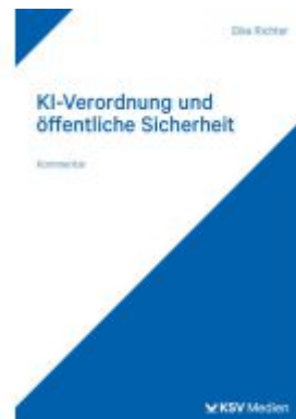
KI-Verordnung und öffentliche Sicherheit Ladenpreis: 60,70EUR