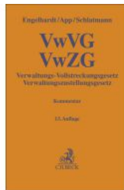
Verwaltungs-Vollstreckungsgesetz, Verwaltungszustellungsgesetz Ladenpreis: 97,70EUR