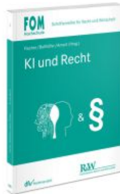
KI und Recht Ladenpreis: 91,50EUR