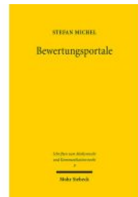
Bewertungsportale Ladenpreis: 96,70EUR