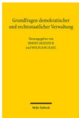
Grundfragen demokratischer und rechtsstaatlicher Verwaltung Ladenpreis: 76,10EUR