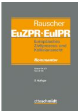
Europäisches Zivilprozess- und Kollisionsrecht EuZPR/EuIPR, Band IV/I Ladenpreis: 225,20EUR