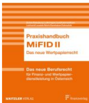
Praxishandbuch MiFID II Ladenpreis: 121,00EUR