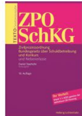
TEXTO ZPO/SchKG Ladenpreis: 30,00EUR