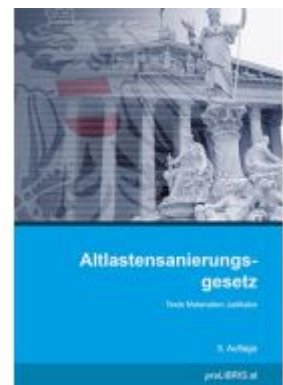
Altlastensanierungsgesetz Ladenpreis: 28,00EUR