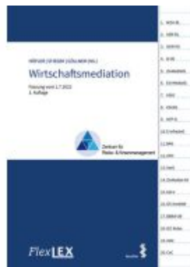
FlexLex Wirtschaftsmediation Ladenpreis: 22,00EUR