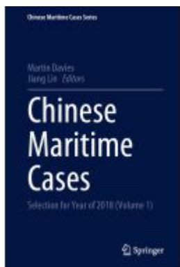
Chinese Maritime Cases Ladenpreis: 362,99EUR