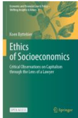
Ethics of Socioeconomics Ladenpreis: 43,99EUR