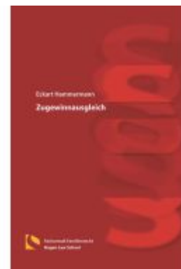
Zugewinnausgleich Ladenpreis: 36,00EUR