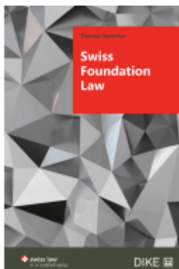
Swiss Foundation Law Ladenpreis: 58,00EUR