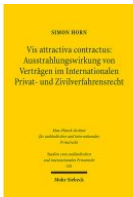
Vis attractiva contractus: Ausstrahlungswirkung von Verträgen im Internationalen Privat- und Zivilverfahrensrecht Ladenpreis: 76,10EUR