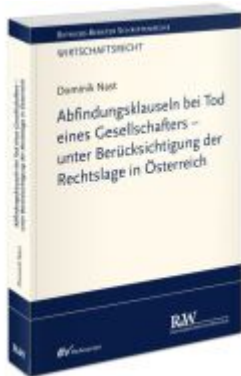
Abfindungsklauseln bei Tod eines Gesellschafters - unter Berücksichtigung der Rechtslage in Österreich Ladenpreis: 91,50EUR