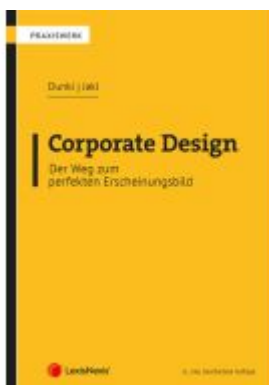
Corporate Design – Der Weg zum perfekten Erscheinungsbild Ladenpreis: 36,00EUR