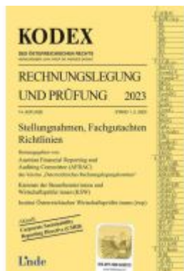
KODEX Rechnungslegung und Prüfung 2023 Ladenpreis: 59,00EUR

Wir haben andere Produkte gefunden, die Ihnen gefallen könnten!