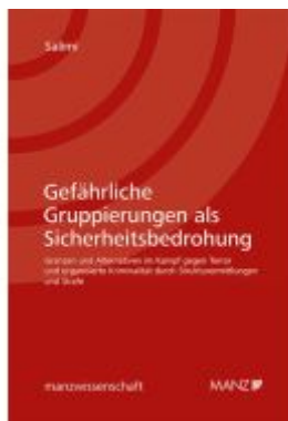
Gefährliche Gruppierungen als Sicherheitsbedrohung Ladenpreis: 118,00EUR