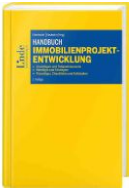
Handbuch Immobilienprojektentwicklung Ladenpreis: 108,00EUR