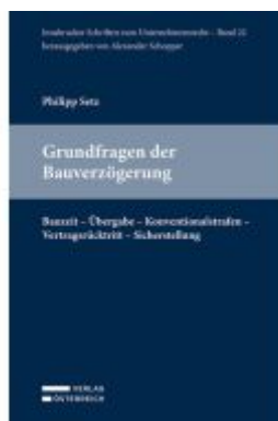
Grundfragen der Bauverzögerung Ladenpreis: 79,00EUR