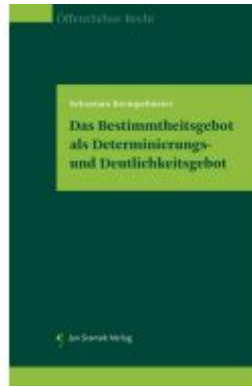
Das Bestimmtheitsgebot als Determinierungs- und Deutlichkeitsgebot Ladenpreis: 78,00EUR