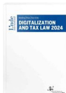
Digitalization And Tax Law 2024 Ladenpreis: 129,00EUR