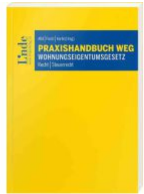
Praxishandbuch WEG I Wohnungseigentumsgesetz Ladenpreis: 98,00EUR