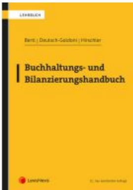
Buchhaltungs- und Bilanzierungshandbuch Ladenpreis: 86,00EUR