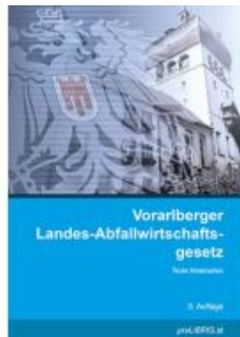
Vorarlberger Landes- Abfallwirtschaftsgesetz Ladenpreis: 21,00EUR