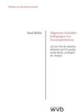
Allgemeine Geschäftsbedingungen von Internetplattformen Ladenpreis: 30,90EUR