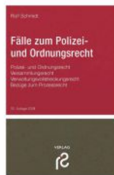
Fälle zum Polizei- und Ordnungsrecht Ladenpreis: 20,40EUR