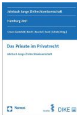
Das Private im Privatrecht Ladenpreis: 79,00EUR