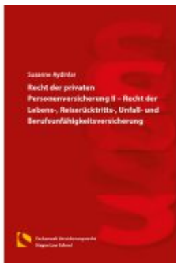
Recht der privaten Personenversicherung II – Recht der Lebens-, Reiserücktritts-, Unfall- und Berufsunfähigkeitsversicherung Ladenpreis: 25,70EUR