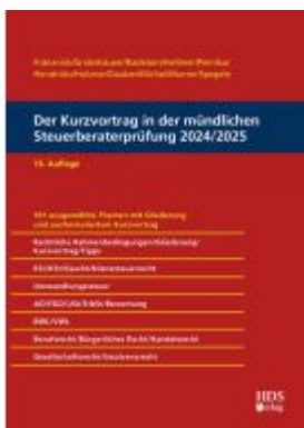
Der Kurzvortrag in der mündlichen Steuerberaterprüfung 2024/2025 Ladenpreis: 61,60EUR