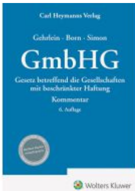
GmbHG – Kommentar Ladenpreis: 194,30EUR

Wir haben andere Produkte gefunden, die Ihnen gefallen könnten!