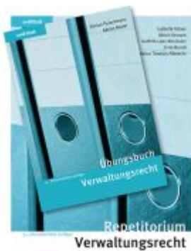
Verwaltungsrecht Kombipaket Ladenpreis: 72,00EUR