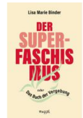
Der Super-Faschismus Ladenpreis: 20,60EUR