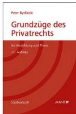
Grundzüge des Privatrechts Ladenpreis: 49,00 EUR