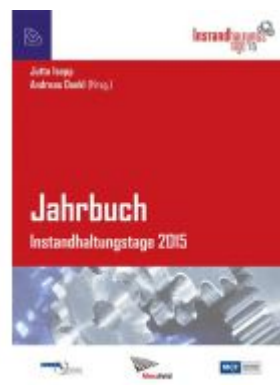
Jahrbuch Instandhaltungstage 2015 Ladenpreis: 54,90 EUR