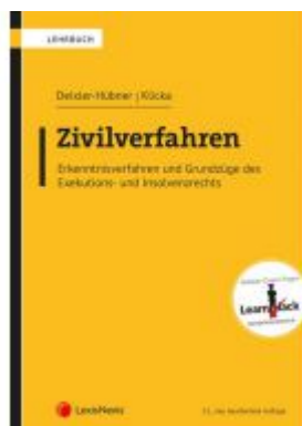
Zivilverfahren Ladenpreis: 64,00 EUR