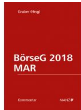
BörseG 2018/MAR Aktionspreis: 298,00 EUR Ladenpreis: 358,00 EUR