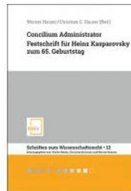
Concilium Administrator Ladenpreis: 68,00 EUR