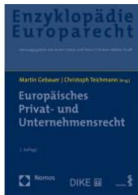
Europäisches Privat- und Unternehmensrecht Ladenpreis: 193,30 EUR