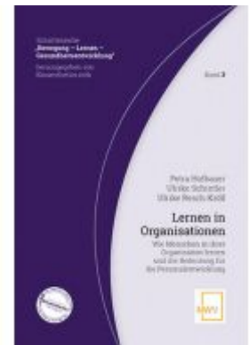
Lernen in Organisationen