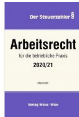
Arbeitsrecht für die betriebliche Praxis 2020/21 Ladenpreis: 85,80 EUR