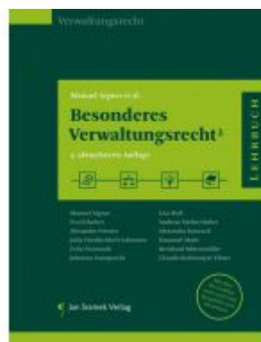
Besonderes Verwaltungsrecht 3 Ladenpreis: 55,00 EUR