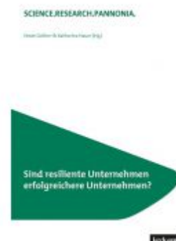
Sind resiliente Unternehmen erfolgreichere Unternehmen? Ladenpreis: 18,50 EUR