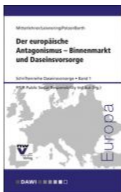
Der europäische Antagonismus – Binnenmarkt und Daseinsvorsorge Ladenpreis: 36,00 EUR