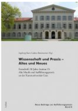
Wissenschaft und Praxis – Altes und Neues Ladenpreis: 19,90 EUR

Wir haben andere Produkte gefunden, die Ihnen gefallen könnten!