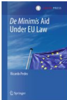
De Minimis Aid Under EU Law Ladenpreis: 109,99EUR