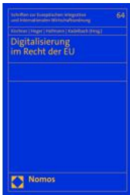
Digitalisierung im Recht der EU Ladenpreis: 76,10EUR

Wir haben andere Produkte gefunden, die Ihnen gefallen könnten!