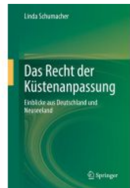
Das Recht der Küstenanpassung Ladenpreis: 102,79EUR