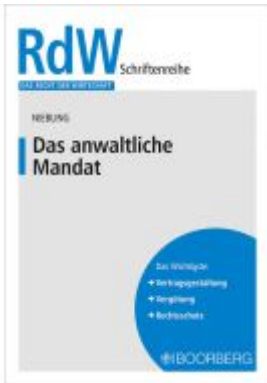
Das anwaltliche Mandat Ladenpreis: 16,40EUR