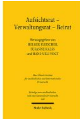
Aufsichtsrat - Verwaltungsrat - Beirat Ladenpreis: 107,00EUR