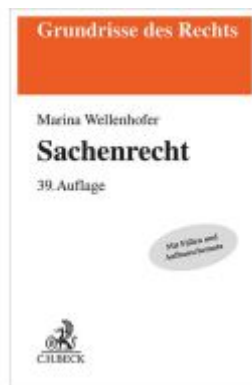
Sachenrecht Ladenpreis: 28,70EUR