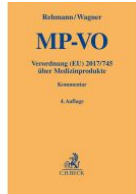
MP-VO Ladenpreis: 132,70EUR