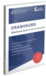
CRASHKURS Öffentliches Recht - NRW Ladenpreis: 28,70EUR