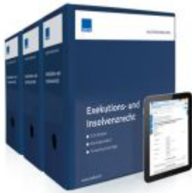
Mustersammlung Exekutions- und Insolvenzrecht Ladenpreis: 283,80EUR