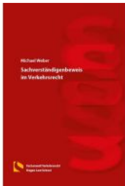
Sachverständigenbeweis im Verkehrsrecht Ladenpreis: 44,20EUR

Wir haben andere Produkte gefunden, die Ihnen gefallen könnten!