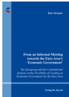
From an Informal Meeting towards the Euro Area's 'Economic Government' Ladenpreis: 91,40EUR