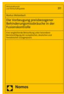
Die Vorbeugung preisbezogener Behinderungsmissbräuche in der Fusionskontrolle Ladenpreis: 112,10EUR