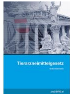
Tierarzneimittelgesetz Ladenpreis: 23,00EUR