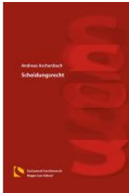
Scheidungsrecht Ladenpreis: 25,70EUR