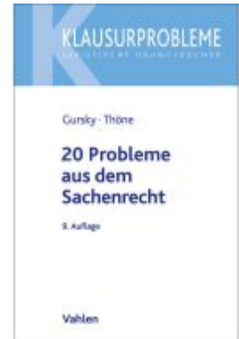
20 Probleme aus dem Sachenrecht Ladenpreis: 22,60EUR